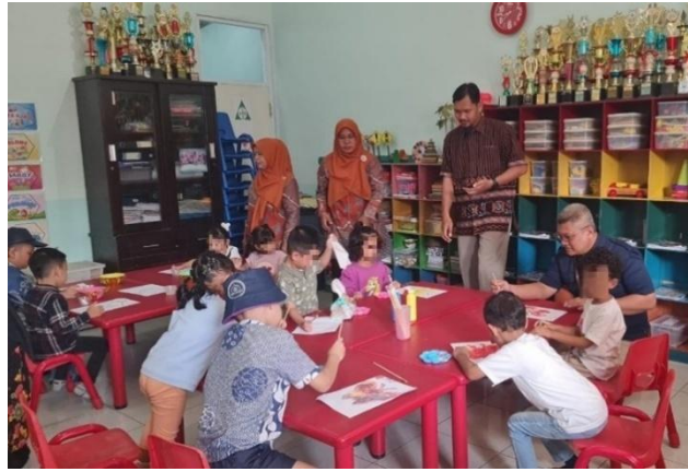
Gambar 3. Kegiatan Intervensi Seni Rupa