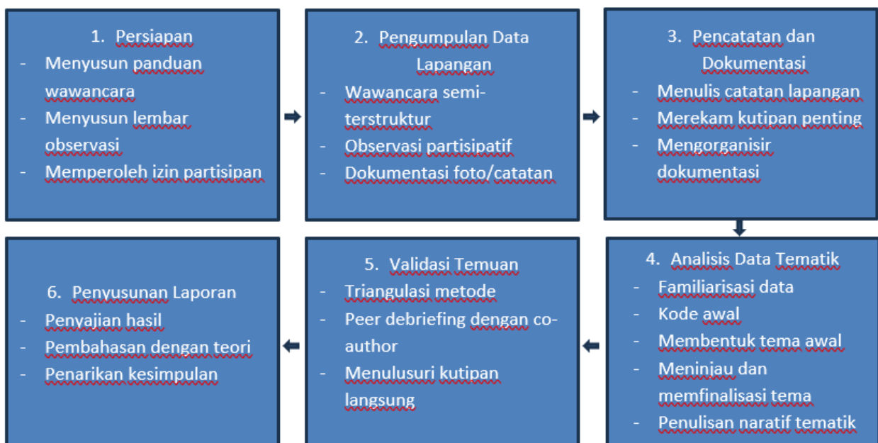
Gambar 1. Alur Penelitian

Analisis dilakukan menggunakan teknik analisis tematik (Braun & Clarke, 2016), melalui enam tahap sistematis: (i) familiarisasi data (membaca dan memahami transkrip wawancara dan catatan observasi), (ii) pemberian kode awal berdasarkan makna berulang, (iii) pencarian tema-tema awal. (iv) peninjauan tema dengan membandingkan antar partisipan, (v) pemberian nama dan definisi tema, (vi) penulisan naratif tematik dengan mengaitkan hasil pada teori literasi dan gender. Keabsahan data dijaga melalui triangulasi metode (wawancara dan observasi) dan peer debriefing bersama penulis pendamping (Gambar 1). Perbedaan interpretasi diselesaikan dengan menelusuri kembali kutipan langsung partisipan dan catatan observasi yang mendukung.