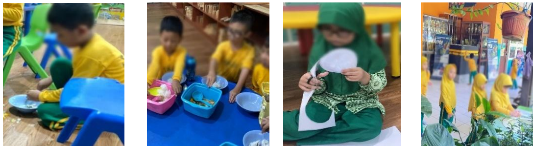
Gambar. 2. Dokumentasi Aktivitas Kegiatan Nyata dalam Pembiasaan Kemandirian Anak

Dengan demikian, tahap evaluasi mencerminkan bahwa peran guru tidak hanya sebagai penilai, tetapi juga sebagai pendamping yang memastikan proses pembiasaan kemandirian berlangsung secara berkesinambungan, baik di lingkungan sekolah maupun di rumah.