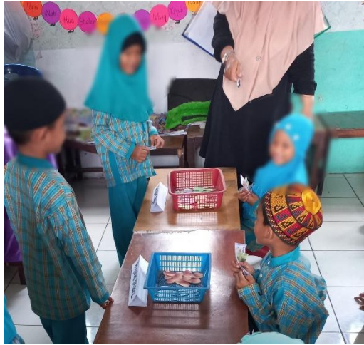
Gambar 2. Kegiatan Bermain Peran di Kelas

terjadi selama kegiatan pembelajaran menjadi data penting dalam menilai perkembangan bahasa anak. Kegiatan bermain peran di kelas dapat dilihat pada Gambar 2.