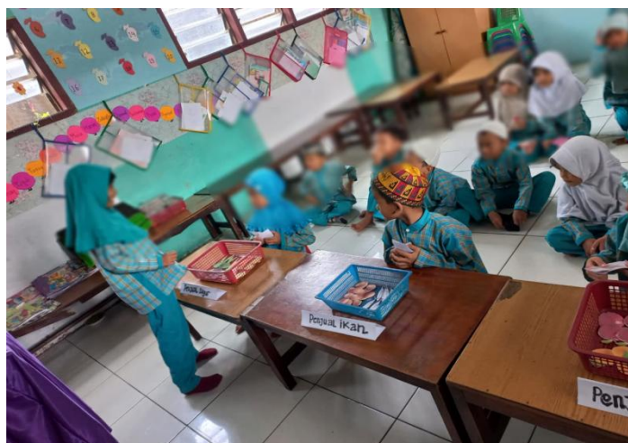
Gambar 4. Penerapan Metode Bermain Peran di Kelas

Bermain peran menjadi suatu kegiatan yang menyenangkan, di mana anak dapat berpura-pura menjadi tokoh tertentu untuk mendapatkan kesenangan. Dalam bimbingan dan konseling kelompok, bermain peran digunakan secara sadar sebagai metode untuk berdiskusi dan memahami berbagai peran dalam suatu situasi (Farida et al., 2022). Di kelas, biasanya sebuah adegan diperagakan secara singkat, sehingga anak bisa mengenali dan memahami karakter yang mereka perankan atau karakter yang dimainkan oleh teman mereka (Noviyanti & Millah, 2019). Karena itu dalam mengoptimalkan kemampuan bahasa menggunakan metode bermain peran harus diperhatikan karena kondisi tersebut dapat melatih kemampuan berbahasa anak, melatih anak pada saat berbicara dengan lancar. Kemampuan berbahasa merupakan salah satu keterampilan penting yang perlu dimiliki oleh setiap individu. Dengan berkomunikasi, seseorang dapat menyampaikan perasaan, keinginan, kebutuhan, ide, serta berbagi informasi. Komunikasi juga memungkinkan seseorang untuk menjalin interaksi sosial dengan orang lain (Hoar, 2023).