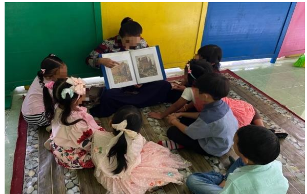
Gambar 2. Kegiatan Pembelajaran Kelas Muslim Gambar 3. Kegiatan Pembelajaran Kelas non-Muslim

Nilai toleransi beragama di sekolah ditanamkan sejak kegiatan pembuka pembelajaran. Anak-anak dibiasakan Memulai hari dengan melaksanakan doa sesuai dengan agama dan kepercayaan masing-masing. Kegiatan ini bukan hanya menjadi rutinitas, tetapi juga sebagai media untuk menanamkan kesadaran spiritual sekaligus membangun sikap saling menghargai di antara sesama.