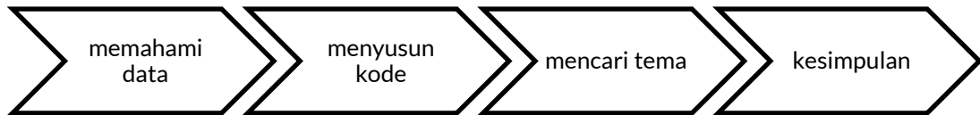
Gambar 2 Tahapan Analisis Tematik

Data yang telah terkumpul kemudian di analisis menggunakan pendekatan analisis tematik. Jenis analisis ini dilakukan dengan cara mengkode data yang diperoleh untuk menghasilkan sebuah tema. Tema bisa merupakan hasil interpretasi dari sebuah fenomena yang sedang diteliti. Tema dapat diperoleh dari orang yang berbeda, konteks berbeda, dan digambarkan oleh kata yang berbeda. Tahapan dalam analisis tematik dapat dilihat pada Gambar 2 (Heriyanto, 2018). Keabsahan data dilakukan dengan triangulasi metode. Setiap data yang diperoleh dari hasil wawancara dicocokkan dengan data dari hasil observasi maupun dokumentasi.